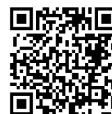
桃園市公立及非營利幼兒園 招生網